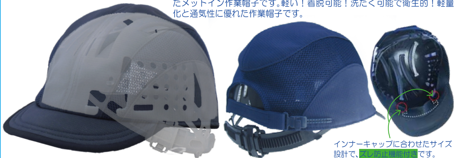
*上記画像は、【涼】二枚天作業帽子にインナーキャップを内装しているイメージです。

【涼】シリーズの新たな形、二枚天作業帽子に一手間加えた安全性を追求したメットイン作業帽子です。軽い！着脱可能！洗たく可能で衛生的！軽量化と通気性に優れた作業帽子です。